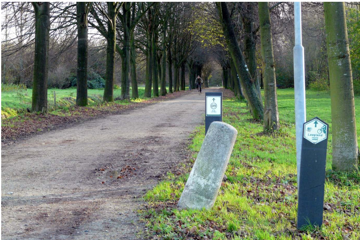
Het Lindelaantje gezien in oostelijke richting (Gouwebos) vanaf het Noordeinde

Het Lindelaantje is één van de toegangspaden tot het Gouwebos en maakt onderdeel uit van de Laaglandroute van de ANWB. Aan het Lindelaantje is ook een parkeerplaats gelegen. Het Lindelaantje eindigt bij de aansluiting aan het Noordeinde.