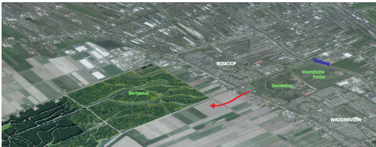
Verbinding Gouwebos-Bentwoud via het te verlengen Lindelaantje

Dit wandel- en fietspad zou dan het (hooggelegen) Noordeinde kruisen, om vervolgens de Eerste Tocht via een brug te passeren. Het is daarbij aan te bevelen een naastgelegen strook als ecologische verbinding (Voorofschepolder-Gouwebos-Bentwoud) te reserveren.