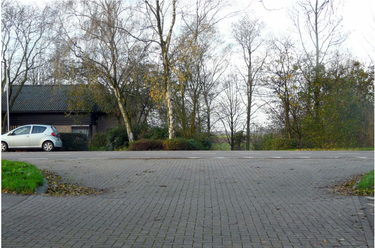
Aansluiting Lindelaantje aan het Noordeinde

Dit wandel- en fietspad zou dan het (hooggelegen) Noordeinde kruisen, om vervolgens de Eerste Tocht via een brug te passeren. Het is daarbij aan te bevelen een naastgelegen strook als ecologische verbinding (Voorofschepolder-Gouwebos-Bentwoud) te reserveren.